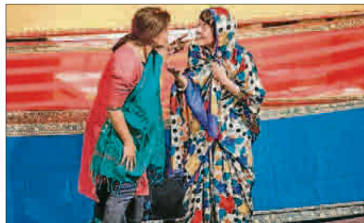
Representación en el Talía de «Les set diferències». ESCALANTE

Un tema que en sus manos se ha transformado en un delicioso espectáculo. En un divertido y emocionante juego. La base es tratar el tema con la mayor cotidianidad: no falta la amistad y la simpatía mutua, dos aspectos que rompen con cualquier atisbo diferente. Sin dejar de ver dicha diferencia: desde el color de la piel a las costumbres heredadas, como la comida. El descubrimiento de esas maneras distintas produce más amistad todavía; y más risa. Es evidente que poder contar con actores de