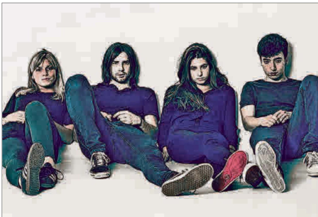
Belako han publicado este año su tercer disco «Render Me Numb, Trivial Violence». L-EMV

mos temas que compusimos y que decidimos incluir en el disco. Pero nos parecía que había un hilo conductor entre las letras de todos los temas, y que justamente ese resumía muy bien el resto del álbum.